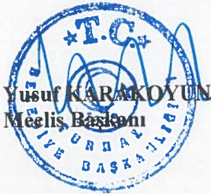
Yusuf KARAKOYUN Meclis Başkanı

Gündemde görüşülecek başka konu olmadığından Meclis Başkanınca meclis üyelerine teşekkür edilerek Turhal Belediyesi Temmuz ayı olağan meclis toplantısı saat:14:50 de kapatıldı.